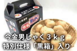
今金男しゃく3kg 特別仕様「黒箱」入り