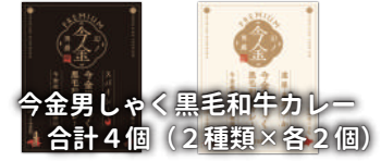
今金男しゃく黒毛和牛カレー 合計4個 (2種類×各2個)