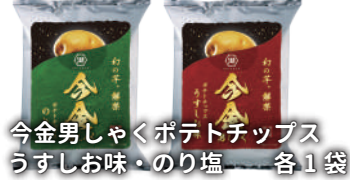
今金男しゃくポテトチップス うすしお味・のり塩 各1袋