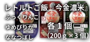
レトルトご飯『今金濃米』 ふっくりんこゆめびりかななつぼし 各1個 (200g×3個)